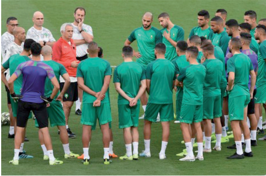
(فولفرهامبتن الإنجليزي)، وزهير فضال (سبورتنينغ لشبونة البرتغالي)، ونايف أغرد (رين الفرنسي). الوسط: هناك كل من عمر القادوري

(باوك اليوناني)، والوفاد الجديد إدريس الصديقي (فيليم 2 الهولندي)، وسفيان أمرباط (فيورنتينا الإيطالي)، ونسيم بوجلاب (شالكة الألماني)، وأيمن برقوق (إينترأخت فرانكفورت الألماني)، وحكيم زياش (تشيلسي الإنجليزي)، وسليم أملاح (سطاندار دو ليج البلجيكي)، وأسامة طنان (فيتاس الهولندي). الهجوم: يوسف العربي (أولمبياكوس اليوناني)، ويوسف النصيري (إشبيلية الإسباني)، وأشرف بنشرفي (الزمالك المصري)، وأشرف حكيمي (إنتر الإيطالي)، وموحى غارسالا (برانسلافا السلوفاكي)، ومنير الحدادي (إشبيلية الإسباني)، وزكرياء لبيض (اياكس الهولندي). يشار إلى أن المباراة الودية الأولى أمام السنغال ستجرى يوم الـ9 من أكتوبر الجاري، فيما سيلعب اللقاء الثاني أمام الكونغو الديمقراطية يوم الـ13 من الشهر ذاته، على أرضية الملعب التابع للمركب الرياضي الأمير مولاي عبد الله بالرباط.