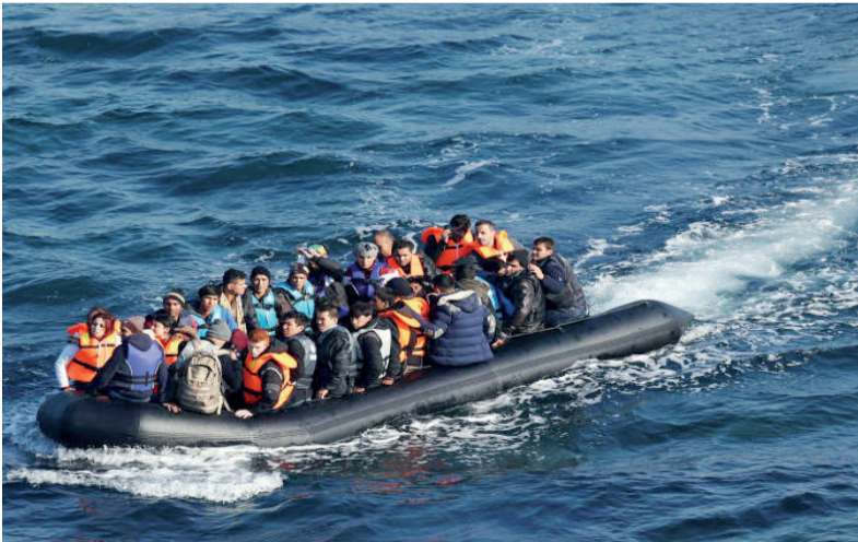
< جمال القرشي

تواصل البحرية الإسبانية كل يوم استقبال أفواج هائلة من المهاجرين القادمين بحرا عبر ما يعرف ب«الزودباتات، و جيسكيات...» و إنقاذهم...وجل هؤلاء المهاجرين، مغاربة قادمين من الريف والشمال. وحسب مصادر إعلامية إسبانية، فإن البحرية ترصد كل يوم قوارب في حالة الغرق، ناوين العبور إلى الضفة الأخرى. حيث يجري نقل المهاجرين إلى مراكز الإيواء، وتقديم لهم الإسعافات الأولية و تسليم لهم الأغذية وبعض المأكولات، وتسليمهم للمصالح الأمنية. ويتم وضع جميع هؤلاء المهاجرين حاليا الذين يصلون إلى السواحل الإسبانية وباقي المناطق في مراكز الإيواء ولا يتم إعادتهم إلى بلدانهم بسبب إغلاق الحدود نتيجة انتشار فيروس كورونا.