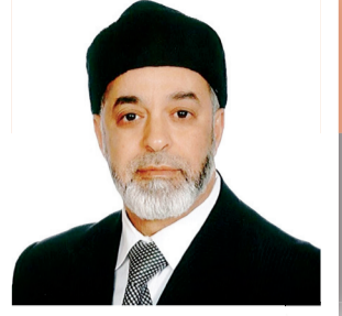
■ بقلم/ د. حسن الجامعي

الحمد لله، وأشهد ألا إله إلا الله، وأشهد أن محمدا رسول الله، صلى الله عليه وعلى آله وصحبه ومن تبعهم بإحسان إلى يوم الدين.